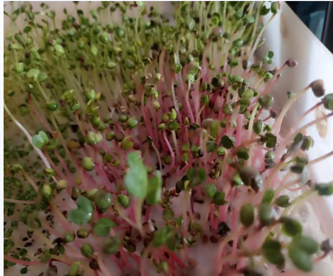
2-rasm. Brassica oleracea mikroko‘katlarining Bacillus spp. tasirida rivojlanishi XULOSA.

Organik biostimulyatorlar Brassica oleracea mikroko‘katlarining o‘shini samarali rag‘batlantiradi. Bacillus spp. eng yuqori poya uzunligi, ildiz rivojlanishi va yashil massani oshirsa, o‘simlik ekstrakti ham biomassani sezilarli darajada oshirdi. Natijalar shuni ko‘rsatadiki, organik biostimulyatorlar mikroko‘katlarni intensiv yetishtirishda samarali va ekologik xavfsiz usul hisoblanadi.